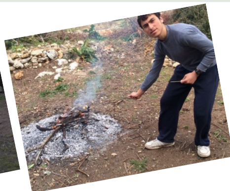
11.30 première recette