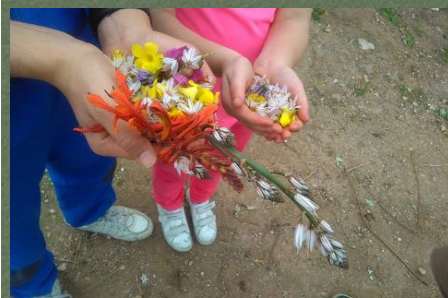
La flore de Février 2016

prochain Rendez-vous Dimanche 10 Avril 2016 De 9.30 jusqu'à 12.00 N'hésitez pas à recruter. Pour plus de détails Contacter: Sylvie 79996271 ou Sophie 99992596