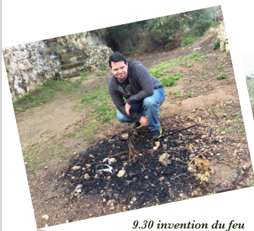
9.30 invention du feu