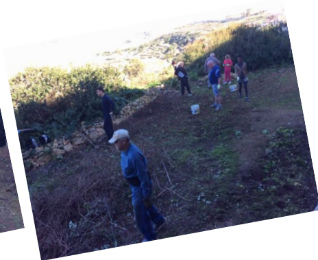
11.30 le mur est dégagé