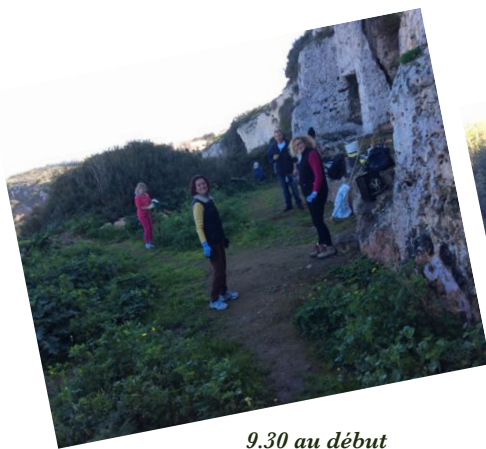
9.30 au début