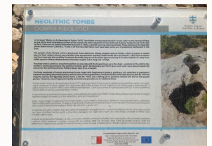
Nouvelles plaques installées par le Kunsil Locali