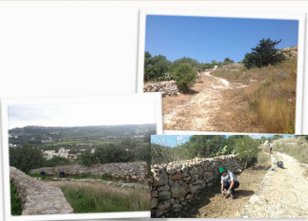
La voie romaine: Avant, Pendant, Après

Il a fait très chaud aujourd'hui 15 Juin. Il est temps que les vacances arrivent.