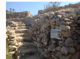
Quelques explications le long du parcours

La mairie de San Pawl Il-Bahar a publié un livret en couleur offrant quelques explications quant au site de Xemxija qui renferme dans un petit espace une vingtaine de monuments d'importance archéologique. Voie, bains, ruches d'origine romaine, tombeaux et caveaux remontant à l'époque des temples néolithiques ou punique, et puis il ne faut oublier les énigmatiques "traces ferroviaires".