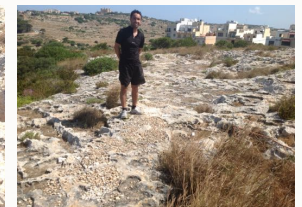
Mise en œuvre du chemin pour les visiteurs