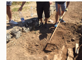
les archéologues mettent à jour de nouvelles preuves du passé