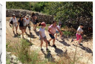
nos petits et grands aventuriers