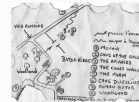
un parcours pour découvrir et s'amuser